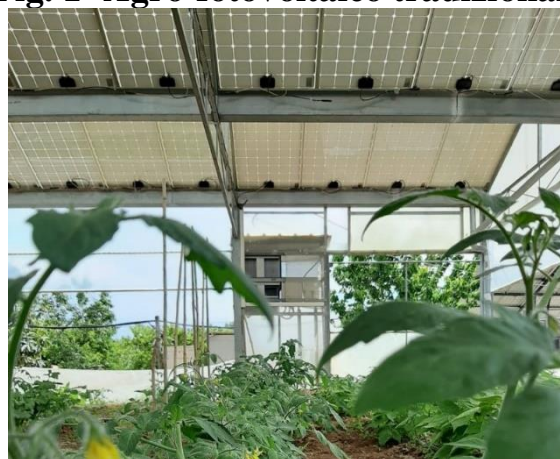
Fig. 2-Agro-fotovoltaico tradizionale

Queste soluzioni riducono però, seppur in misura contenuta, la produzione agricola a causa degli ombreggiamenti, e hanno costi aggiuntivi rispetto all'installazione a terra, in parte compensati dall'irraggiamento riflesso dal terreno, se i pannelli sono a doppio vetro.