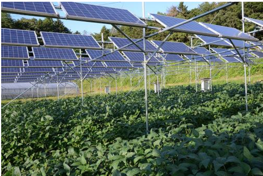
Fig. 3 – Agro-fotovoltaico con tracker monoassiali

Per risultare ottimale la soluzione, illustrata in Fig. 3, richiede infatti non solo installazioni a quota significativa (2,3-2,5 m), ma anche distanziate, per evitare ombreggiamenti reciproci, mentre lo spostamento dei tracker per inseguire la traiettoria del sole evita l'ombreggiamento permanente di una parte del suolo.