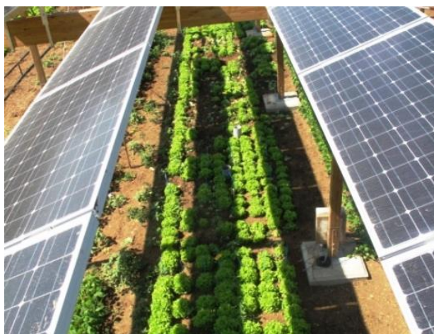
Fig. 1 -Agro-fotovoltaico tradizionale

Le Figg. 1 e 2 illustrano le configurazioni sviluppate in particolare in Germania.