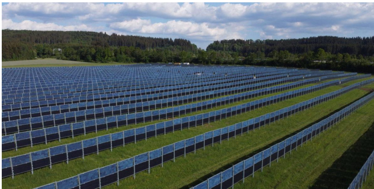
Fig. 5 – Agro-fotovoltaico con pannelli bifacciali

Interessante è anche la soluzione adottata in Germania, con pannelli fotovoltaici bifacciali (Fig. 5).