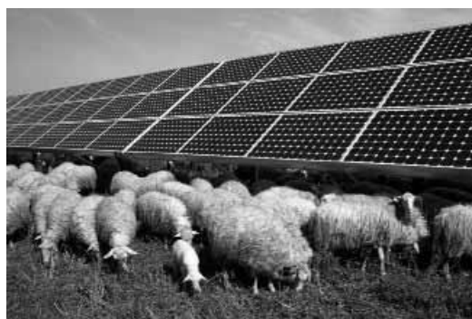
Fig. 6 – Pecore che pascolano presso l'impianto FV

Se le condizioni locali lo consentono, si potranno considerare diverse opportunità, come quella suggerita dall'esperienza di Sant'Alberto, un'area agricola situata in provincia di Ravenna, dove da anni funziona un impianto fotovoltaico della potenza nominale di 35 MWp, con un'estensione di 71 ettari (ma l'effettiva superficie coperta dai pannelli è inferiore al 40%), integrato a un allevamento estensivo di ovini (Fig. 6).